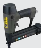
KNG 40 SYS*