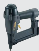
KLG 90-40 SYS*