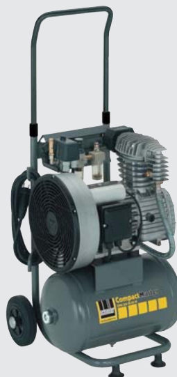
CPM 342-10-20 W