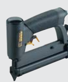
PNG-PN 25 SYS*