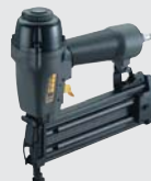
SNG-SK 50 SYS*