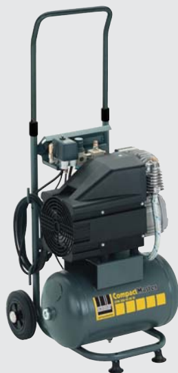
CPM 300-10-20 W

Kup jedną z wymienionych sprężarek z dowolnym zszywaczem, gwoździarką lub sztyfciaarką a otrzymasz zszywacz KLG 80-16 nr kat. D200091 za 1 PLN