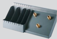
Modul MAS-Store 3-10 Artikel-Nr. B 060 001