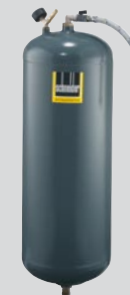
Modul MAS-Tank 3-10 Artikel-Nr. H 110 610