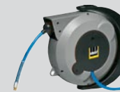
Modul MAS-Schlauchaufroller Artikel-Nr. B 312 511