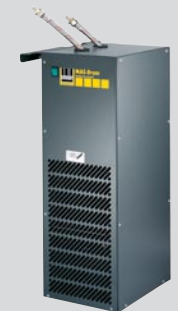
Modul MAS-Dryer 3-10 Artikel-Nr. H 611 000